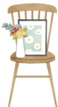
お気に入りの絵や切り花を飾るなど、季節にあわせたコーディネートを楽しむスペースを。

デザインが美しい椅子をベースに、スペースを作るのもおすすめです。観葉植物や花器、アートフレームなどを飾ったり、郵便物や雑誌置き場として利用したり。低めのスツールは、ソファ横でコーヒーテーブルとして活用しても。部屋の雰囲気作りや整とんにひと役買ってくれます。